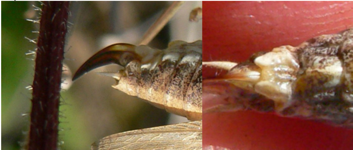
lieu : Nîmes (30)