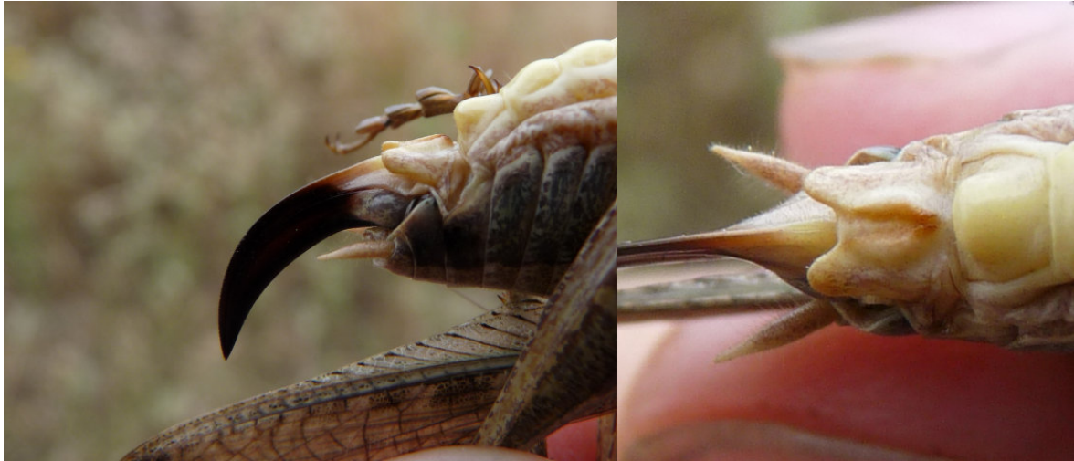
lieu : Ponteilla (66)