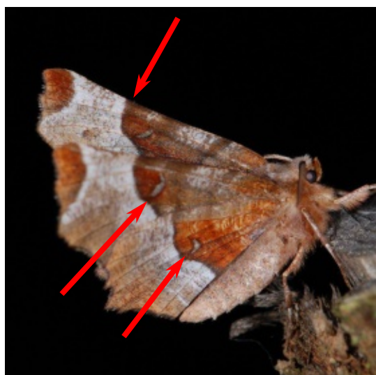
Selenia tetralunaria Ennomos illustre