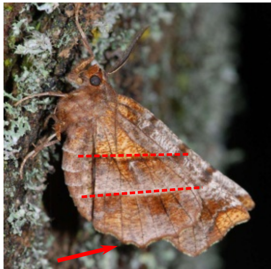
Selenia dentaria Ennomos illunaire