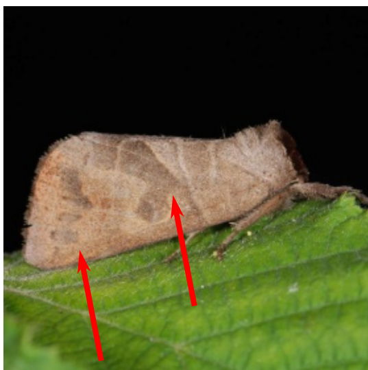
Clostera anastomosis Hausse-queue grise