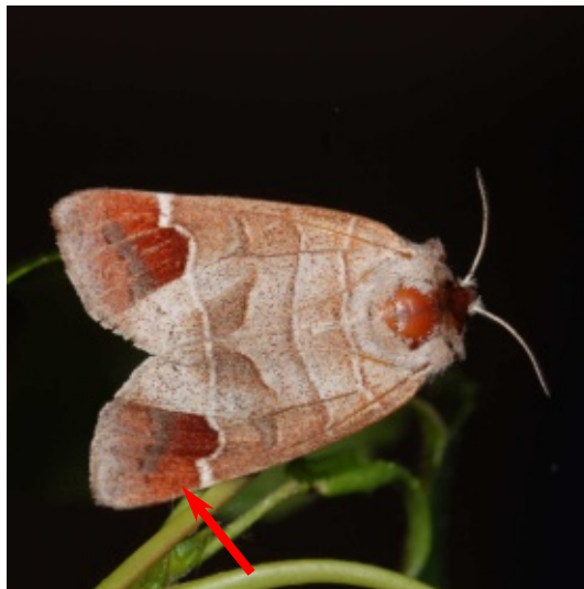
Clostera curtula Hausse-queue blanche