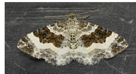
Gewone bandspanner Epirrhoe alternata

Epirrhoe alternata versus Epirrhoe rivata