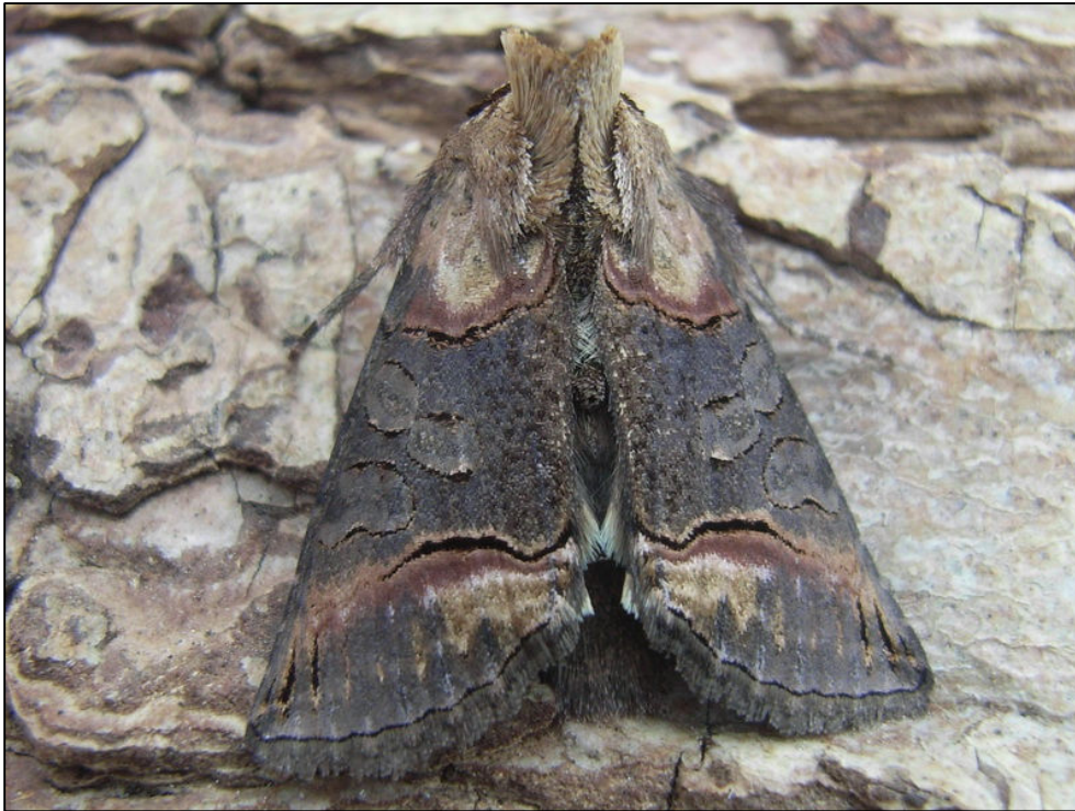
Typisch exemplaar van Donker brandnetelkapje