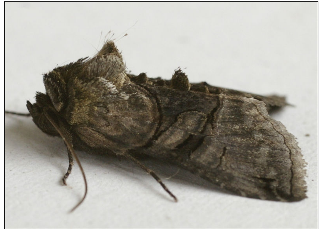
Donker exemplaar van Brandnetelkapje (forma plumbea ): witte tekening ontbreekt, maar de andere kenmerken kloppen hier wel.