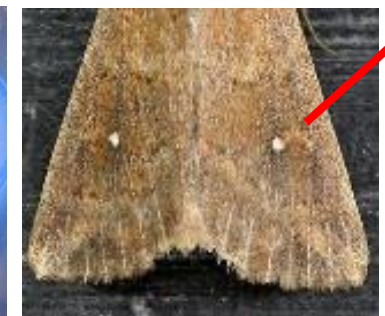
Witstipgrasuil ( M. albipuncta )