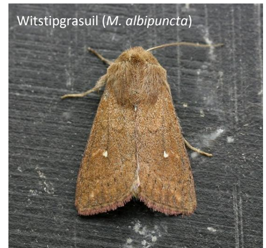
Witstipgrasuil ( M. albipuncta )