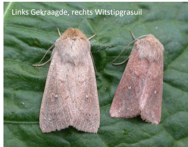
Links Gekraagde, rechts Witstipgrasuil