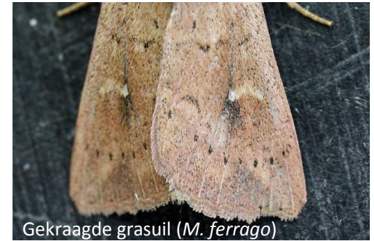
Gekraagde grasuil ( M. ferrago )