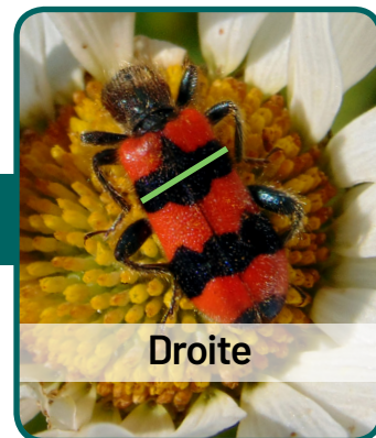
Clairon des abeilles Trichodes apiarius